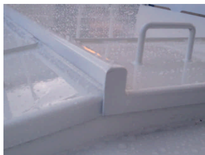
Övervikt fals för optimal lucktätning