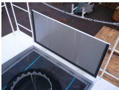
Stora, dammtäta luckor